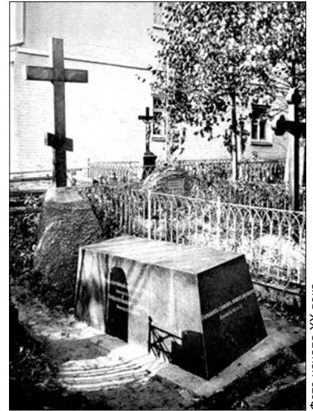
фото начала XX века.

По словам поэта Василия Жуковского, настоящим призвани-