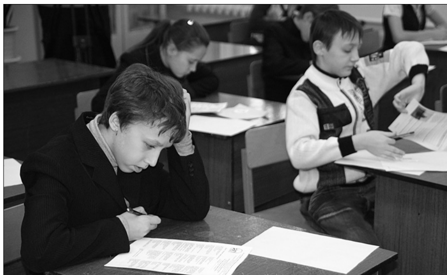
фото иерод. Феофила.