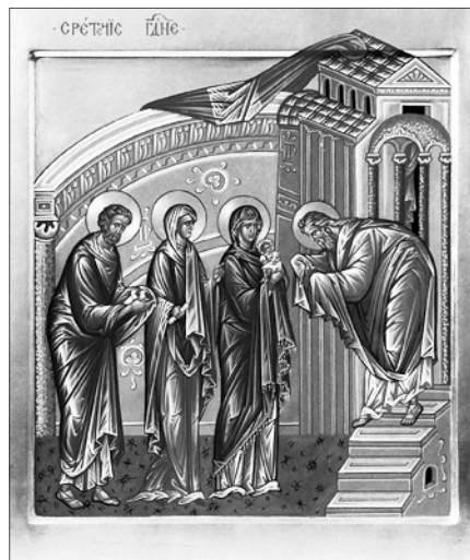
Сретение Господне. Сийская иконописная мастерская.

14 февраля — неделя (воскресенье) сыропустная. Воспоминание Адамова изгнания. Прощеное воскресенье. Заговенье на Великий пост. (По уставу, на этот день с понедельника, 15 февраля, переносится служба праздника Сретения Господня). В это воскресенье после вечерни совершается чин прощения.